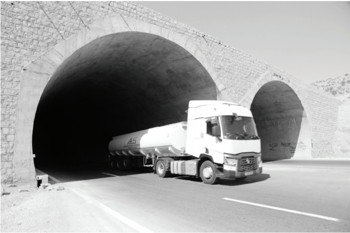
مدیرکل دیوان محاسبات فارس، نبود روشنایی

سنگین در آزادراه به رغم ممنوعیت آن و به ویژه در شرایطی که امکان نظارت بر سرعت آنها نیز وجود ندارد مشکلات و معضلاتی را ایجاد کرد که در این زمینه نیز باید تدبیری اندیشیده شود.