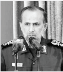
فرمانده سپاه فجر

«نذر رهایی» یک طرح شاخص فرهنگی و اجتماعی در سطح کشور است