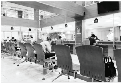
مدیرکل دیوان محاسبات فارس

ازدراه شیراز به استان اصفهان به طول ۲۱۲ کیلومتر و به‌عنوان طولانی‌ترین آزادراه ایران روز ۲۰ مهر ۱۴۰۲ هم‌زمان با سفر رئیس‌جمهور به استان فارس به بهربرداری رسید.