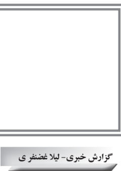
گزارش خبری- لایلا غضنفری

در تاریخ ۳ دی‌ماه سال جاری بعد از گذشت حدود ۳ ماه از افتتاح رسمی آزادراه اصفهان – شیراز دومین تصادف زنجیره‌ای با یک فوتی به ثبت رسید.